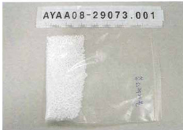
Imagen de muestra recibida